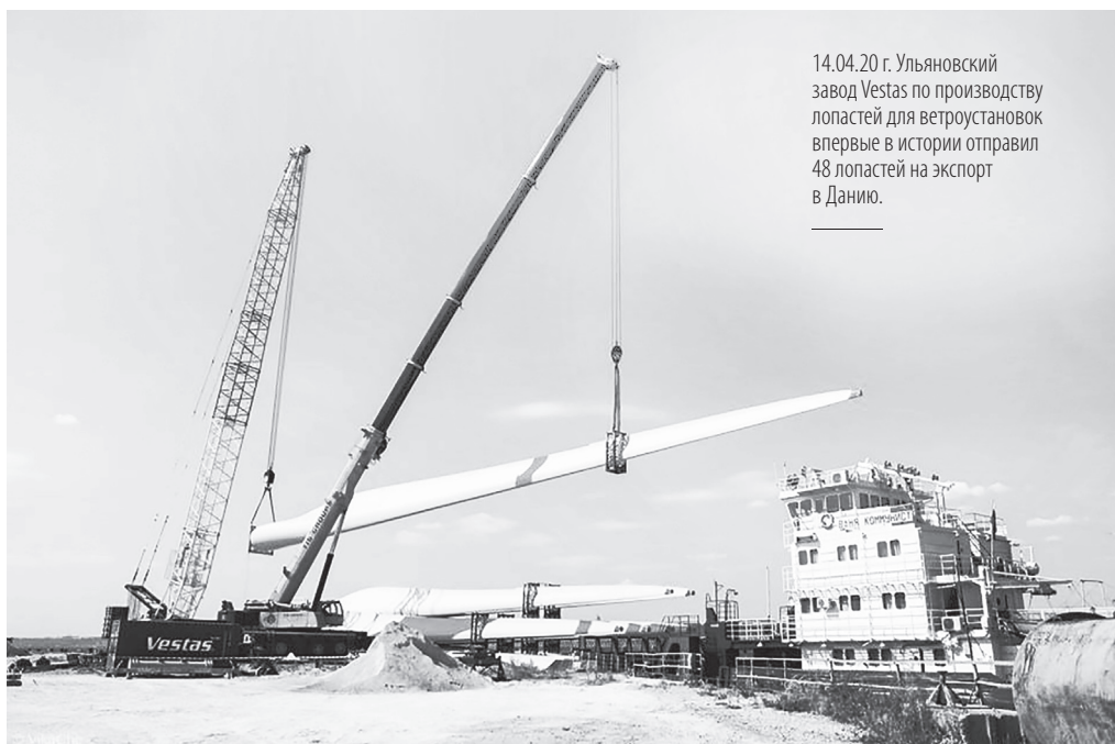
14.04.20 г. Ульяновский завод Vestas по производству лопастей для ветроустановок впервые в истории отправил 48 лопастей на экспорт в Данию.

Продолжают развиваться иностранные и российские компании, которые уже разместили свои предприятия в регионе. Так, начинается строительство логистического комплекса компании Bridgestone, компания АВ InBev Efes инвестирует в запуск на ульяновском заводе новой производственной линии, Nemat приступает к реализации проекта по изготовлению компонентов для автомобилей Hyundai и Kia, белорусская компания «Полесье» реализует второй этап проекта по созданию в ТОСЭР «Димитровград» производства детских игрушек из пластмассы. Несмотря на пандемию, компания Vestas смогла отправить первую партию лопастей с ульяновского завода на экспорт в Данию, компания Martur приступила к проекту ор-